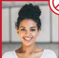
Paisagem ao fundo