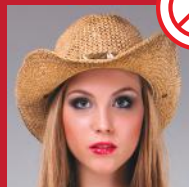
Uso de chapéus